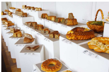
Slika 1: Dobrote slovenskih kmetij