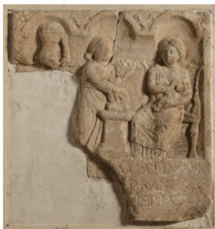
Slika 2: Poškodovana posvetilna plošča iz marmorja